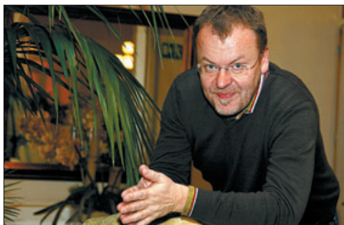
►► Stefan Ruzowitzky, el director de la pel·lícula, a Madrid.

«No la considero una pel·lícula sobre els nazis –assegurava el cineasta dimarts a Madrid–, és un relat d'aventures situat en un camp de concentració. Fa 40 anys a Alemanya i Àustria encara hi havia nazisme en posicions socials clau, i els dits acusadors eren pertinents. Ja no, la meva pel·lícula és perquè