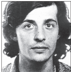
Salvador Puig Antich.