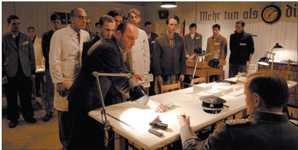
►► Escena d' Els falsificadors en què els deportats jueus mostren el resultat del seu treball a l'autoritat nazi.

I la llibertat li produeix sensacions noves. «Noto com un petit desfasament amb la llibertat perquè tinc la impressió d'estar en una societat futurista. Hi ha llocs molt nets, molt asèptics, les grans pantalles de televisió als cafès, que no coneixia, càmeres per tot arreu, una sèrie de coses que em fan la impressió de viure en el futur, el meu futur. És el vostre present, però és el meu futur».